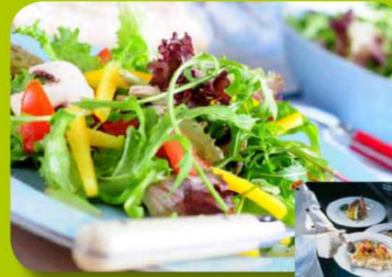
Gesunde nahrhafte und leckere Speisen, unterstützt durch modernste Gastronometechnik.